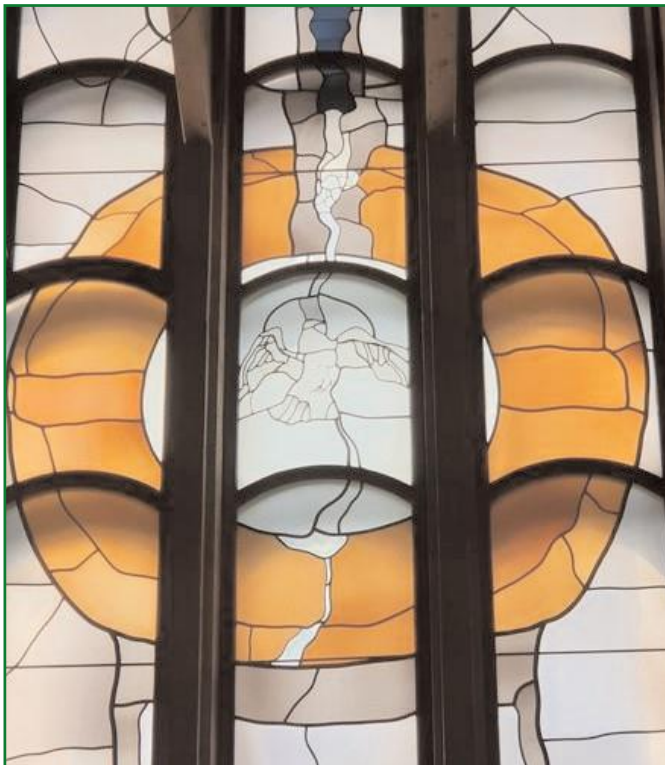
Glasfenster in der Kirche Zum Heiligsten Erlöser, Göggingen